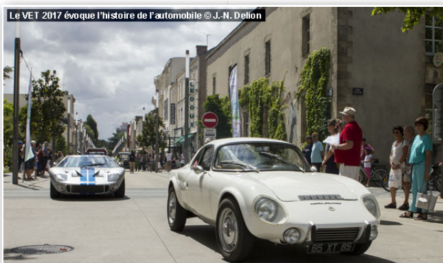
Le VET 2017 évoque l'histoire de l'automobile

Dressés sur l'île d'Yeu du 2 au 3 juin, et à Noirmoutier-en-l'Île les 9 et 10 juin, les villages de la mobilité accueilleront diverses animations, dont certaines réservées aux enfants. Des essais de véhicules électriques seront possibles. Parmi les engins à (re)découvrir : le concept car Renault DeZir, l'ElectroCox de Jérémy Cantin, le Volkswagen T3 de Rémi Pilot également converti à l' électrique , la Méhari historique E-Story de Méhari Loisirs, et le concept Heol d'Eco Solar Breizh.