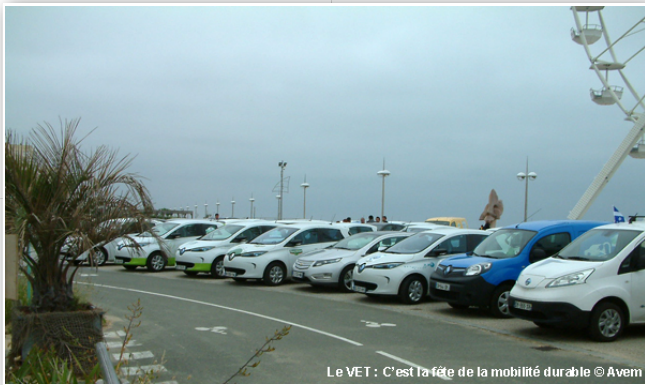
Le VET : C'est la fête de la mobilité durable