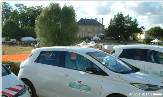
Le Vendée énergie Tour, une organisation très bien orchestrée !

Posté le 03/05/2018 à 09:45 par Philippe Schwoerer - Lu 62 fois - Poster un commentaire