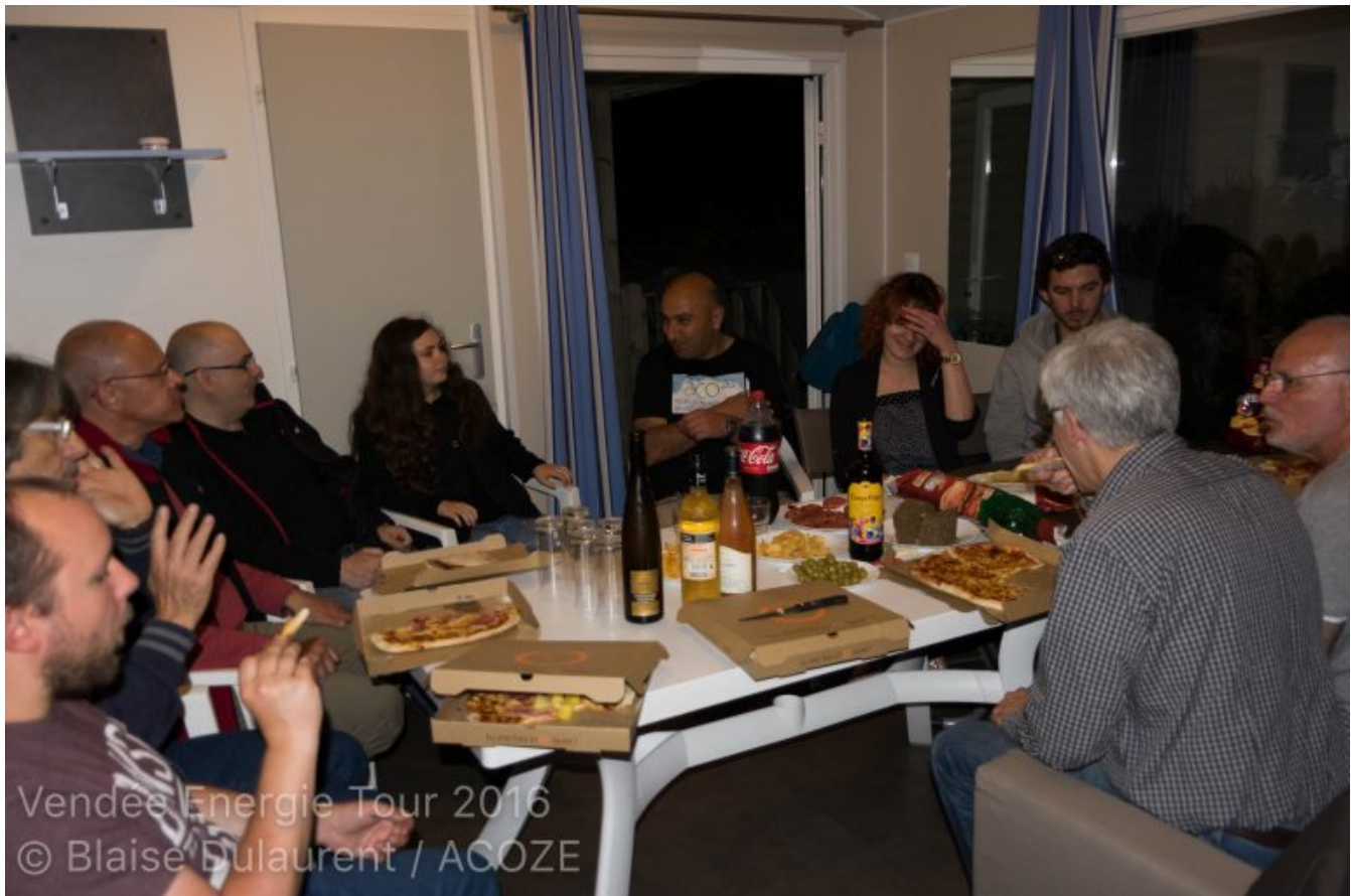
Vendée Energie Tour 2016

Le 3 juin , démarre par l'animation du stand ACOZE ( PHOTOS) dans l'enceinte du LECLERC, en majorité tenu par Joëlle et moi-même, tandis que le reste de l'équipe parti s'inscrire au rallye en ont profité pour distribué des disques ACOZE et des flyers.