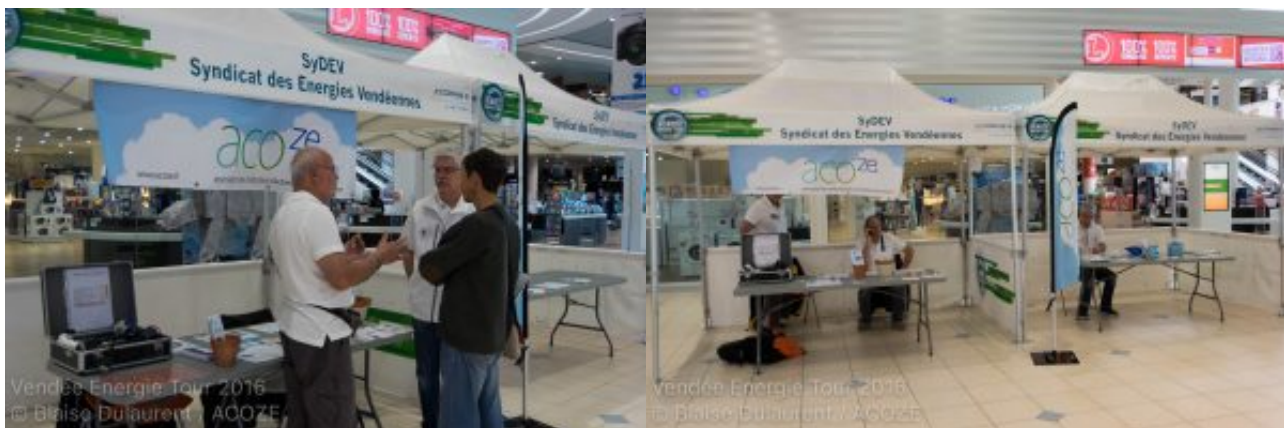
Vendée Energie Tour 2016

Le 3 juin , démarre par l'animation du stand ACOZE ( PHOTOS) dans l'enceinte du LECLERC, en majorité tenu par Joëlle et moi-même, tandis que le reste de l'équipe parti s'inscrire au rallye en ont profité pour distribué des disques ACOZE et des flyers.